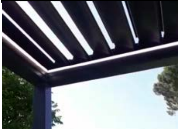
STRIP LED PERIMETRALI