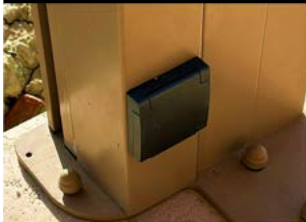
PRESE SU COLONNE