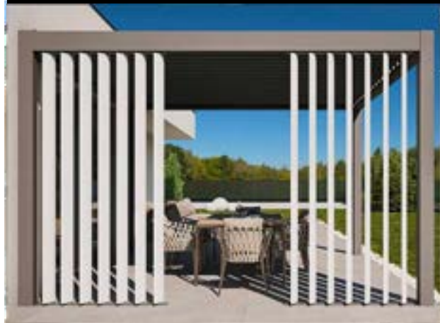
FRANGISOLE VERTICALI ALLUMINIO