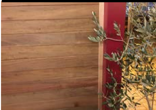
RIVESTIMENTO LEGNO IPE' DA ESTERNO