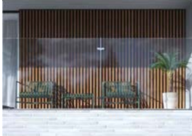
RIVESTIMENTI ALLUMINIO + LEGNO