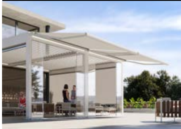
TENDE DA SOLE