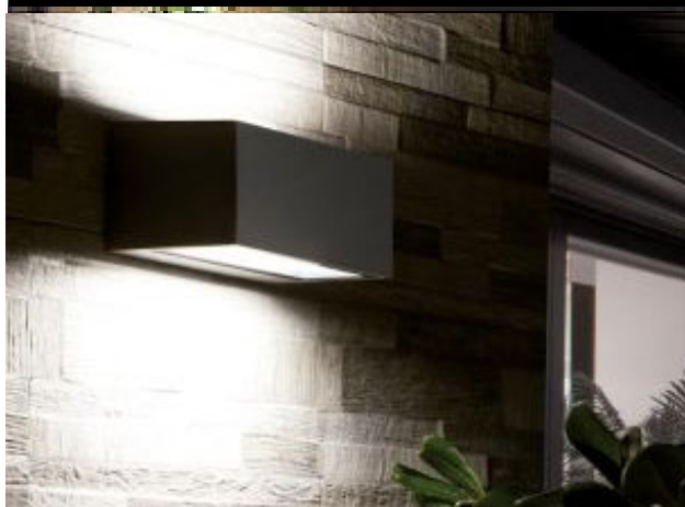
APPLIQUE DA ESTERNO