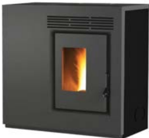
STUFE A PELLETT