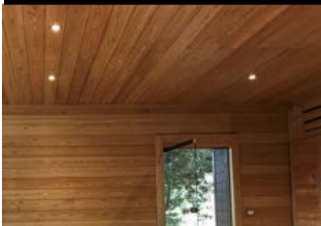
SPOT LED A SOFFITTO