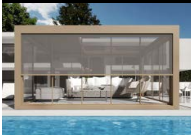
TENDE FILTRANTI A RULLO ANTIVENTO