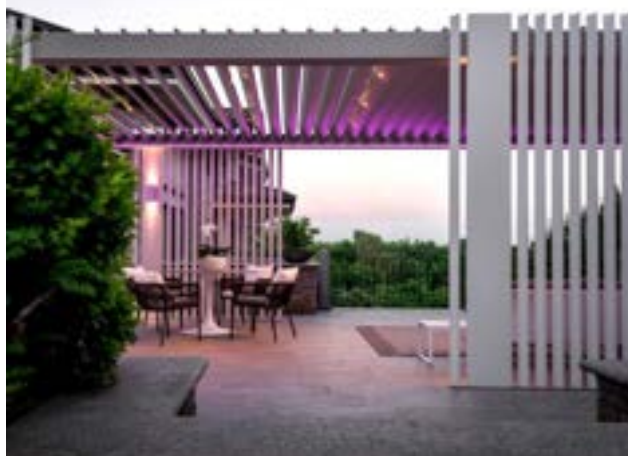
FRANGISOLE FISSI VERTICALI ALLUMINIO