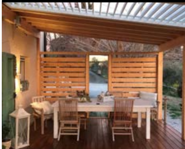
RIVESTIMENTI ORIZZONTALE LEGNO E VETRO