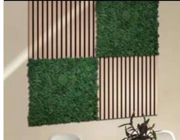
PANNELLI DI MUSCHIO