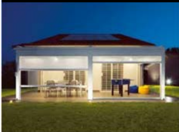
ZANZARIERE AVVOLGIBILI VERTICALI