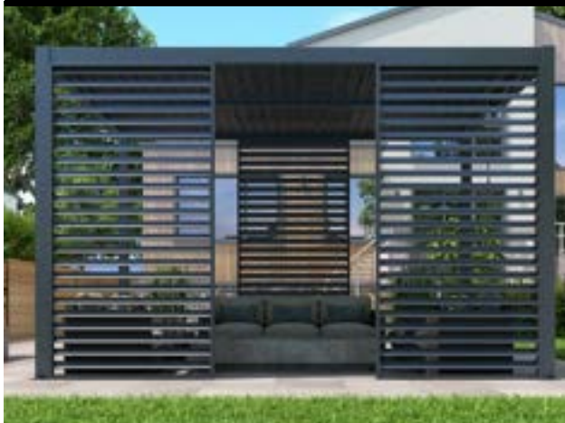
FRANGISOLE FISSI E SCORREVOLI ALLUMINIO