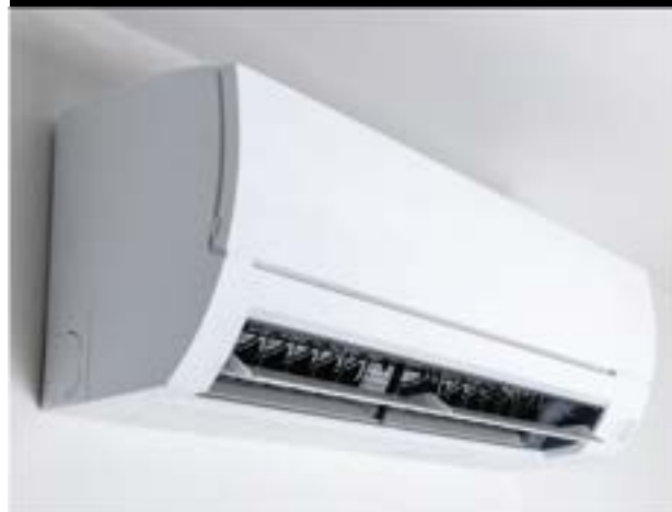
CLIMATIZZATORI FRESCO - CALDO