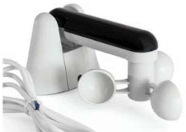
SENSORI LUCE – VENTO - PIOGGIA