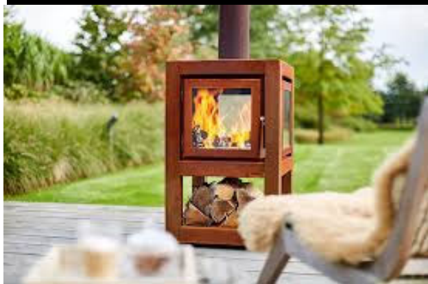
STUFA A LEGNA