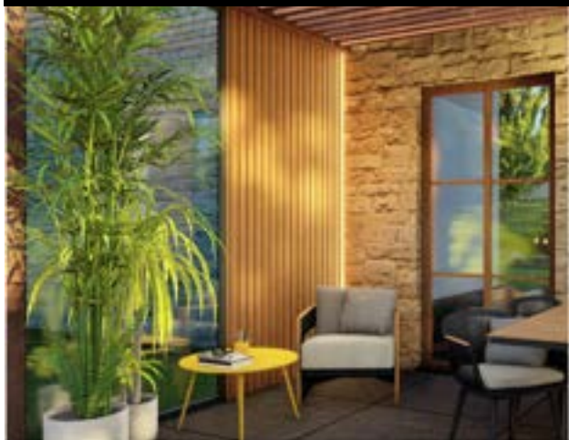
RIVESTIMENTO ALLUMINIO E LEGNO